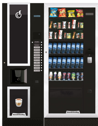
LEI600 + ARIA L MASTER

LEI600, distributore automatico per bevande calde con capacità di 600 bicchieri.