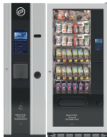
FAS Mia + Fas 750 Business