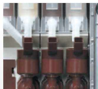
Mixer Fas ad alta resa con sistema auto aspirante