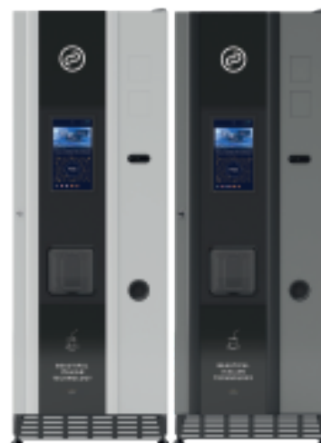
Fas Lydia + Fas Lydia Grafite