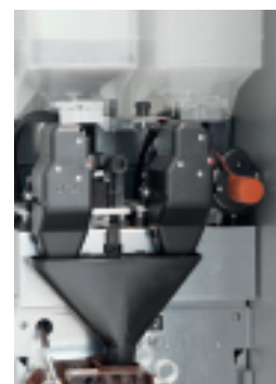
Regolazione automatica della macinatura su caffè top